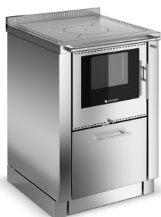
PANORAMA Nerezová ocel