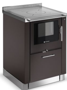
PANORAMA Šedo-hnědá F2 Korpus v šedo-hnědé F2 (volitelně)