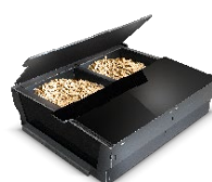
PELLET BOX (volitelně)