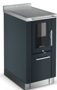
PANORAMA Antracit F9 Korpus v Antracit F9 (volitelně)