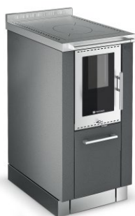
PANORAMA Černo-stříbrná F1