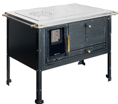
PANORAMA (volitelně) DEKOR Vintage