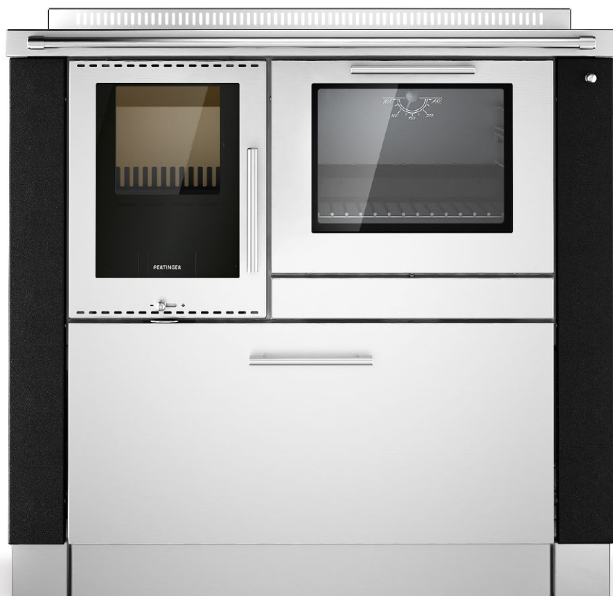
PANORAMA Černá F5 / nerezová ocel