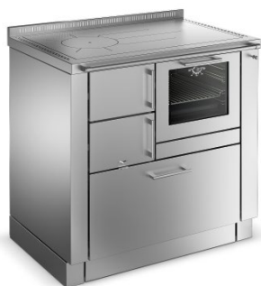
TREND Nerezová ocel