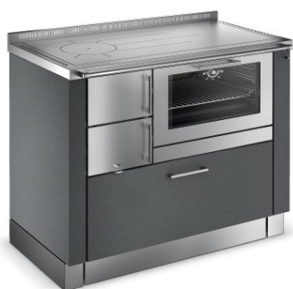
TREND Černo-stříbrná F1