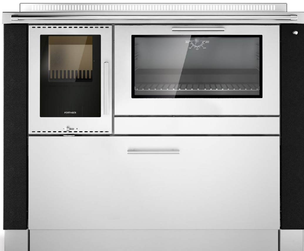
PANORAMA Černá F5 / nerezová ocel