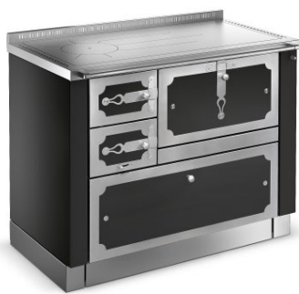
DEKOR ST04 / Černá F5