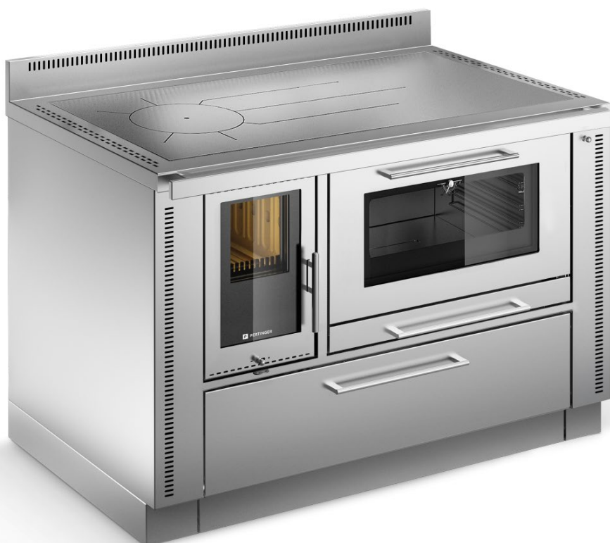
PANORAMA Nerezová ocel