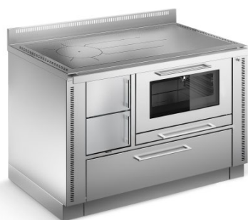
TREND Nerezová ocel