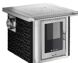
PANORAMA Nerezová ocel