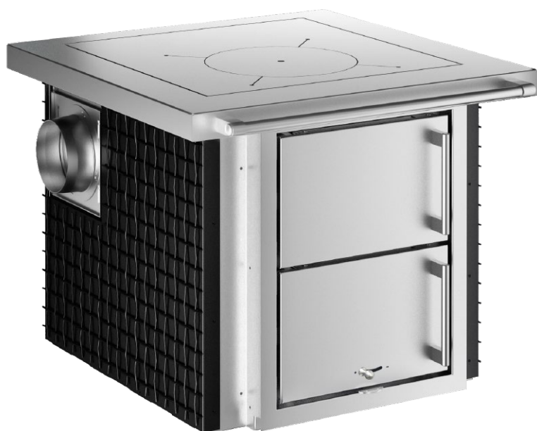
TREND Nerezová ocel